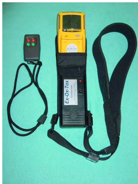
Optie: GasAlert Max XT Instructor